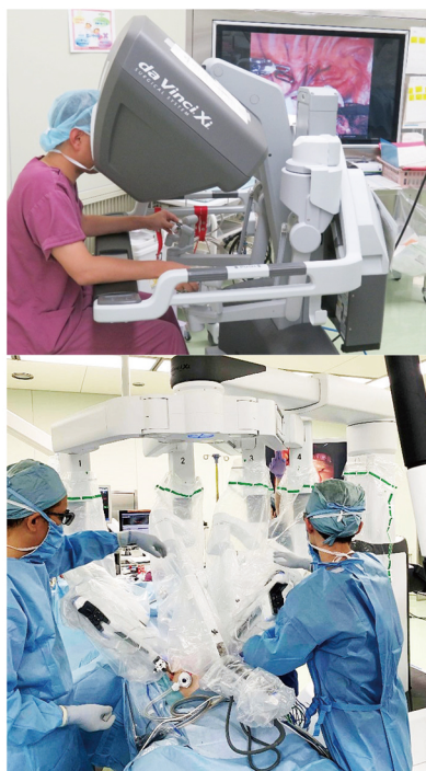
当院での低侵襲手術(ロボット手術)の様子

わが国の胃癌治療の進歩はめざましく、その内容は高度化・多様化・専門化そして複雑化しております。そのため、胃癌の診療は複数の診療科が関与し診断・治療を進めていくことが求められています。手術の場合、病院当たりの手術症例数や術後合併症の有無が患者さんの予後に影響することが分かっており、侵襲の少ない手術を普及させていくことが重要と言えるでしょう。このような現状を踏まえ、日本胃癌学会は適切で質の高い胃癌治療を提供できる施設を認定する制度を発足しました。